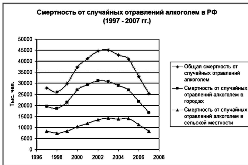
Рис. 2. Смертность от случайных отравлений алкоголем в РФ (1997–2007 гг.) Диаграмма составлена Н.И. Григулевич

Абсолютный максимум по случайным отравлениям алкоголем (74,2 в целом; 83,2 в сельской местности) показала в 1994 г. Тверская область. Минимум таких смертей (1,1) отмечен в том же году в Дагестане. Второе место за Башкирией (21,0). В начале – середине 2000-х гг. в стране опять отмечался всплеск «алкогольной» смертности (рис. 2), который являлся следствием экономического кризиса 1998 г. В сельской местности наблюдается более плавный, чем в городах, подъем этого показателя. Так как две трети населения России живут в городах, то неудивительно, что городские показатели примерно в два раза выше сельских.